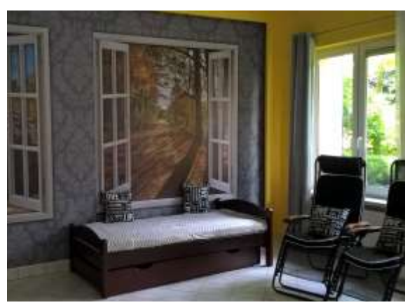
Dom Dziennego Pobytu „Kalinka” – pomieszczenie do odpoczynku